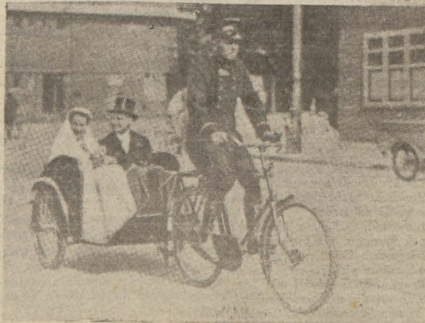
Amsterdama yeni evlenen çiftler kiliseden çıktuktan sonra yukarıda görüldüğü muhteşem arabaya kurulmakta ve caddelerden geçerek yuvalarına dönmektedirler.